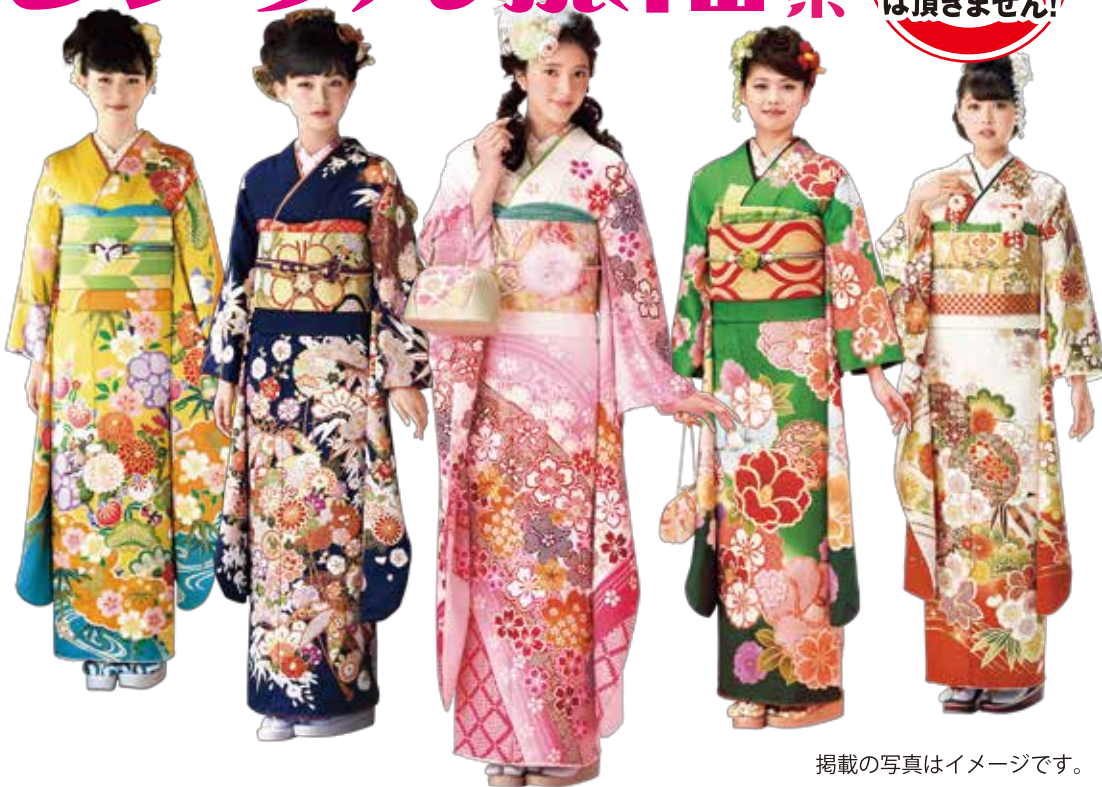
掲載の写真はイメージです。

最新柄を常時 多数展示中! 開催日以外でも ご来店ください お下見も、ご試着も 大歓迎!