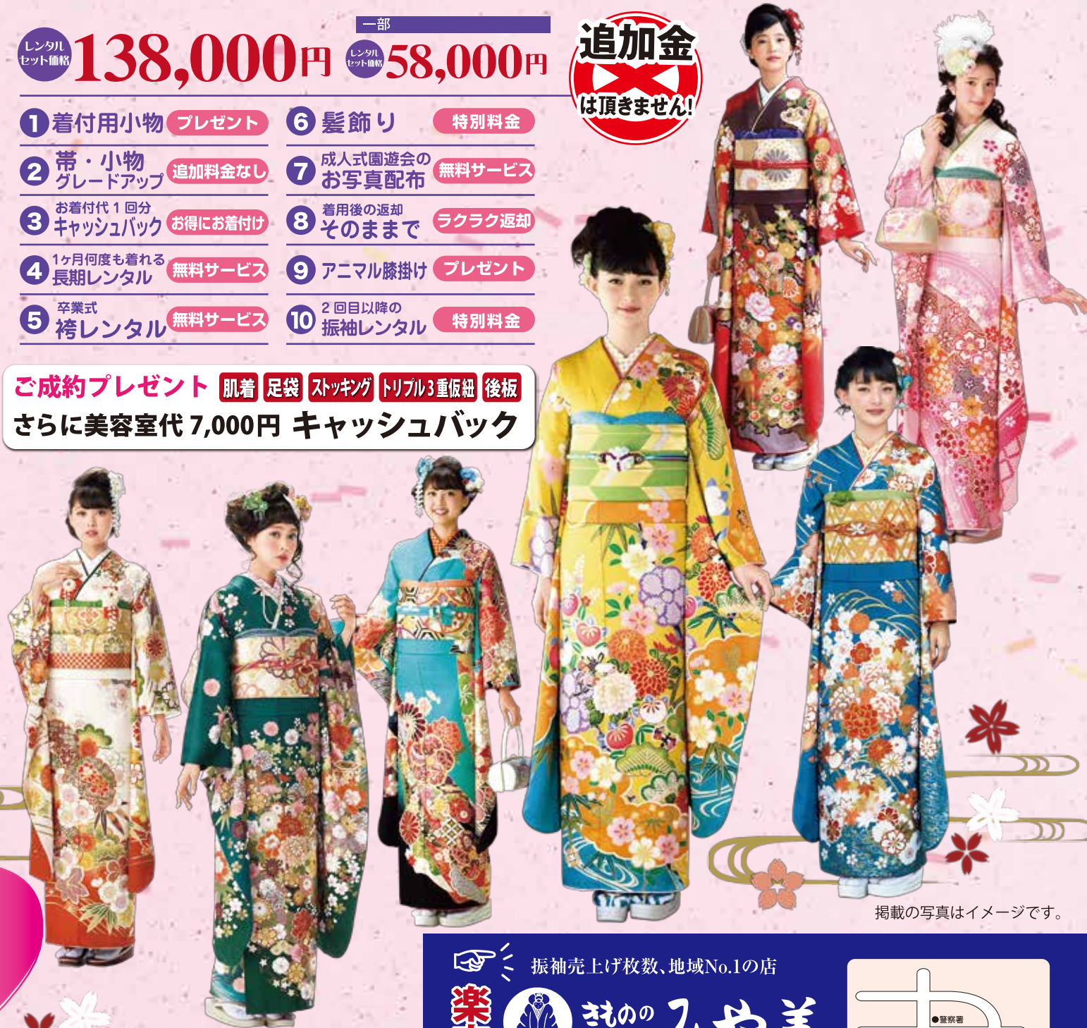
掲載の写真はイメージです。

ご成約プレゼント 肌着 足袋 スッキング トリプル3重仮紐 後板 さらに美容室代 7,000円 キャッシュバック