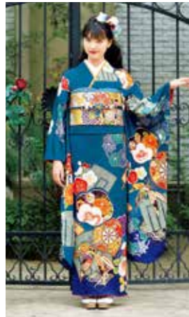
お買上げフルセット価格 280,000 円(税抜)