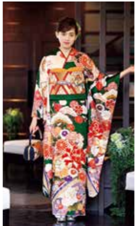
お買上げフルセット価格 380,000 円(税抜)