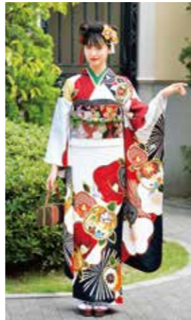
お買上げフルセット価格 330,000 円(税抜)