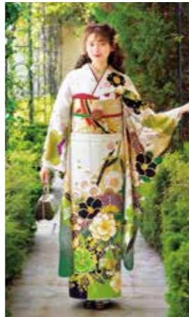
お買上げフルセット価格 380,000 円(税抜)