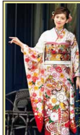
お買上げフルセット価格 380,000 円(税抜)