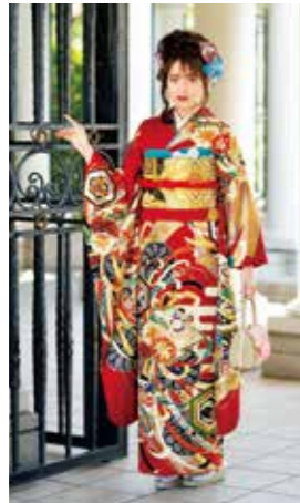
お買上げフルセット価格 430,000 円(税抜)