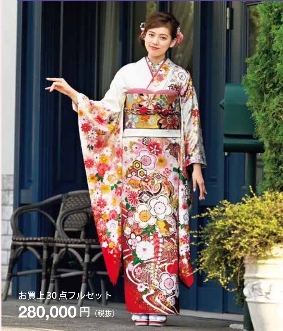
お買上30点フルセット 280,000円 (税抜)

2021年1月はもちろん2022年1月の成人式に参加される方も、新生活が始まりお忙しいと思いますがこのGolden Week期間中に、ぜひご来店ください！