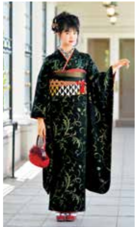
お買上げフルセット価格 330,000 円(税抜)