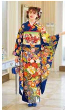
お買上げフルセット価格 580,000 円(税抜)