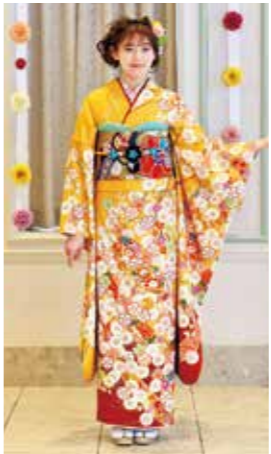
お買上げフルセット価格 380,000 円(税抜)